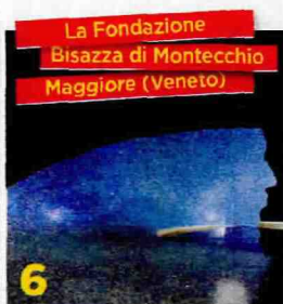
La Fondazione Bisazza di Montecchio Maggiore (Veneto)

GUIDA D'AUTORE Vale un viaggio è una guida di Beba Marsano.