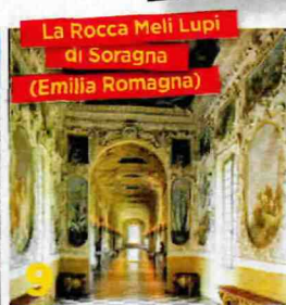
La Rocca Meli Lupi di Soragna (Emilia Romagna)

Museo a cielo aperto: cappelle e tombe sono opere d'arte costruite dalle famiglie ricche della città.