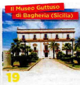
Il Museo Guttuso di Bagheria (Sicilia)

Nel Parco della Murgia, gli affreschi di Adamo ed Eva ricoprono i muri di una chiesa rupestre.