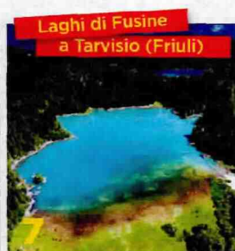
Laghi di Fusine a Tarvisio (Friuli)

Mosaici che diventano opere d'arte grazie a designer come Mendini, Paladino e Sottsass.