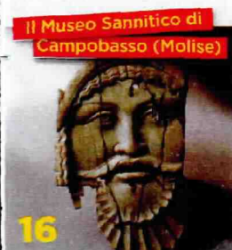
Il Museo Sannitico di Campobasso (Molise)

Villaggio medievale fortificato, racchiuso dalla cinta muraria che lo ha protetto dalle invasioni.