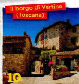
Il borgo di Vertine (Toscana)

Era una fortezza medievale, è stato trasformato in residenza nobiliare con mobili e arredi sontuosi.