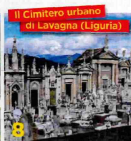
Il Cimitero urbano di Lavagna (Liguria)

Co-protagonisti del film La ragazza del lago , i due bacini sono quasi nascosti da un fitto bosco di abeti.