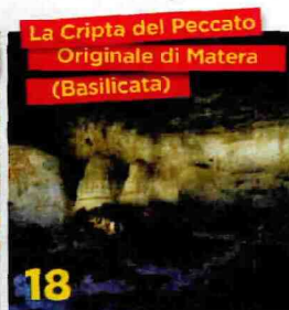
La Cripta del Peccato Originale di Matera (Basilicata)

Una giungla di affreschi che ricoprono pareti, archi e volte, in una sorta di storia sacra a fumetti.