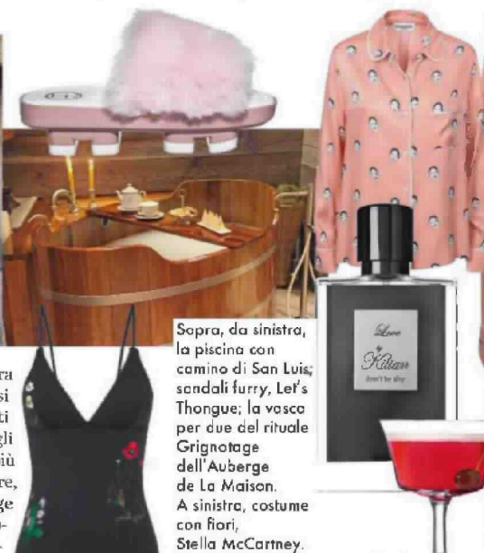
Sopra, da sinistra, la piscina con camino di San Luis; sandali furry, Le's Thongue; la vasca per due del rituale Grignotage dell'Auberge de La Maison. A sinistra, costume con fiori, Stella McCartney.

Tentazioni a fior di pelle. Per riscaldare l'atmosfera anche a 1.400 metri ci pensa la San Luis spa, oasi wellness sull'altipiano di Avelengo, con trattamenti calienti, con fagottini di erbe alpine o massaggi agli oli aromatici ( www.sanluis-hotel.com ). Vi sentite più wild? Fate i "beauty eremiti" nel rifugio di benessere, prenotabile a uso esclusivo, nella spa dell' Auberge de La Maison , a Courmayeur: con il rituale Grignotage au Refuge , oltre al bagno di fieno, vasca di legno per due e un trattamento su misura, con champagne e prelibatezze locali ( www.aubergemaïson.it ). Se vi sentite novelle principesse, la Sissi Suite sarà il vostro nido asburgico nel restaurato Grand Hotel Imperial di Levico con soini regali ( www.hotel-imperial-levico.com ). Decisamente più "piccante" la Spa Vair di Borgo Egnazia, con il programma Kur Spezzet , per cuori infranti e corso di cucina di coppia ( www.borgoegnazia.it ).