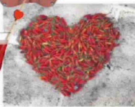
Sopra, il cocktail amoroso di Moët&Chandon, cuore di peperoncini nella spa di Borgo Egnazia. A sinistra, un dettaglio del Gran Hotel Imperial di Levico.