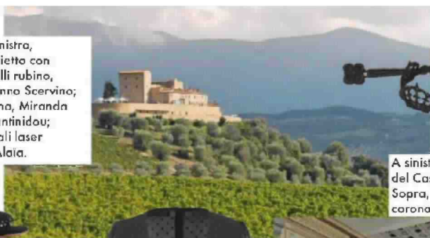
A sinistra, veduta del Castello di Petroia. Sopra, bracciale con corona crochet, Cruciani.