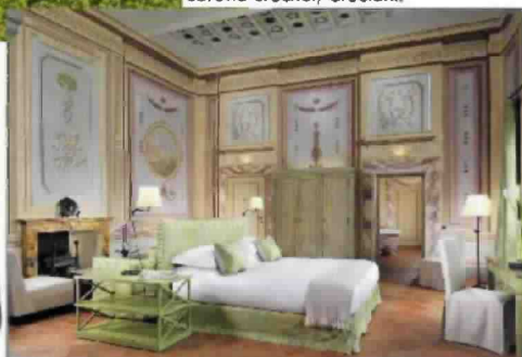
Sopra, da sinistra, in senso orario. Vestito plumeris con ruches, For Love and Lemons. Una suite del Castello del Nero. Scorcio notturno del Castello di Granarola. Mocassino lamé con tacca squared, Paola d'Arcano. Choker di Toolei, su yoox.com.