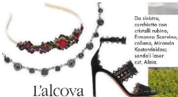
Da sinistra, cerchietta con cristalli rubino, Ermanno Scervino; collana, Miranda Kostantinidou; sandali laser cut, Alaïa.