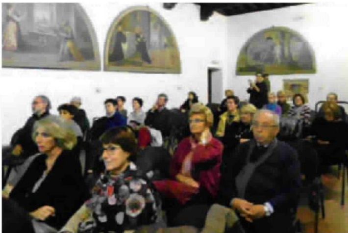
Pubblico alla presentazione di "Vale un Viaggio", in Santa Croce, alle Lunette