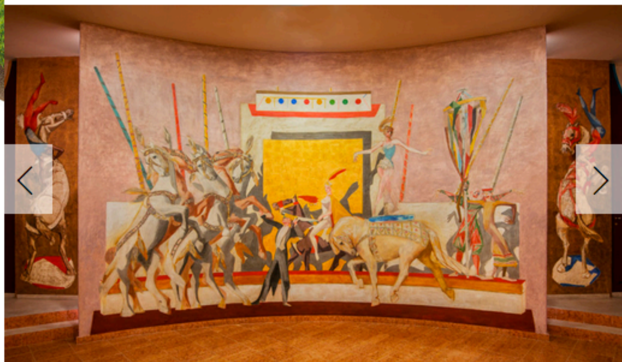
7-7 ARENA CASARINI

C entouno luoghi da riscoprire, tutti italiani. Antichi, suggestivi, magici, segreti. Sono i protagonisti di Vale un viaggio , un libro di Beba Marsano (Cinquesensi Editore) dedicato alle meraviglie architettoniche e paesaggistiche del Belpaese.