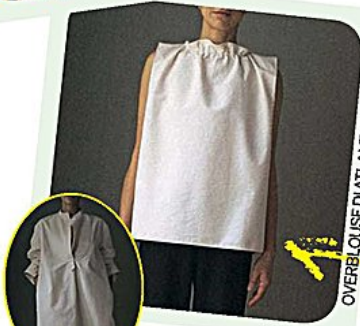
OVERBLOUSE DI ATLANTIQUE ASCOLI