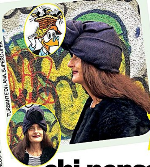
TURBANTE DI LANA. SUPERDUPER