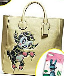
BORSA COVER PER IPHONE COACH