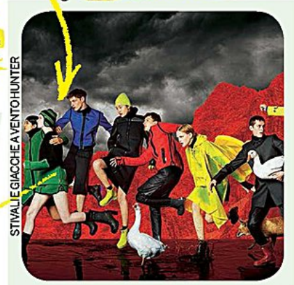
STIVALIE GIACCHE A VENTO HUNTER