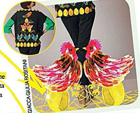
GIACCA GIULIA FOSTANI