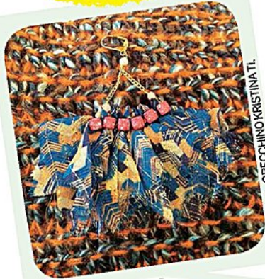
ORECCHINO KRISTINA TI.