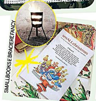
SMALLBOOKS E BRACIERE FANCY