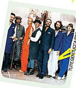
TUTE GENTILE UCCA BINI